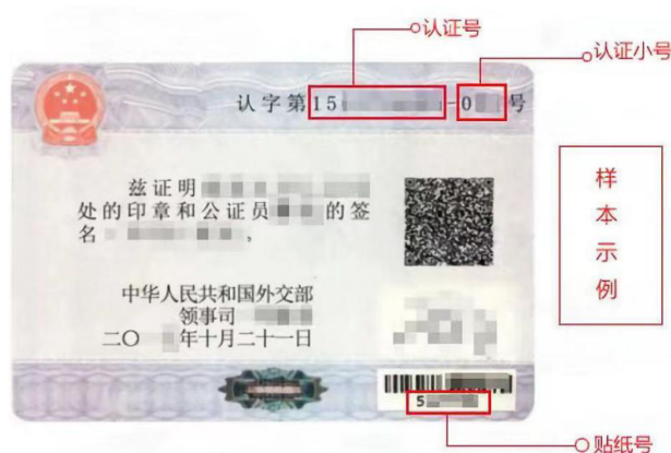
图二 传统领事认证书式样

附加证明书与领事认证书具备同等效力。同传统领事认证一样，附加证明书仅证明所证公文书的来源，